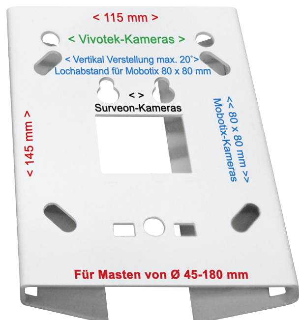
Der neue „clevere“ universal Masthalter