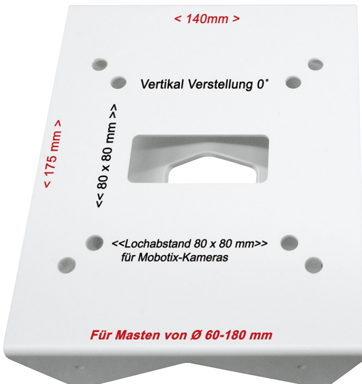
Mobotix original Masthalter

Schluss mit einseitig hängendem Horizont. Schluss mit unterlegen des Masthalters, einfach stufenlos verstellen.