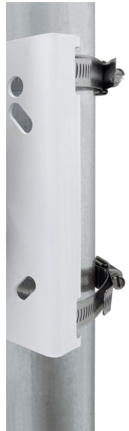
Vivotek original Montageplatten (schwarz) montiert auf vorhandener Bohrung