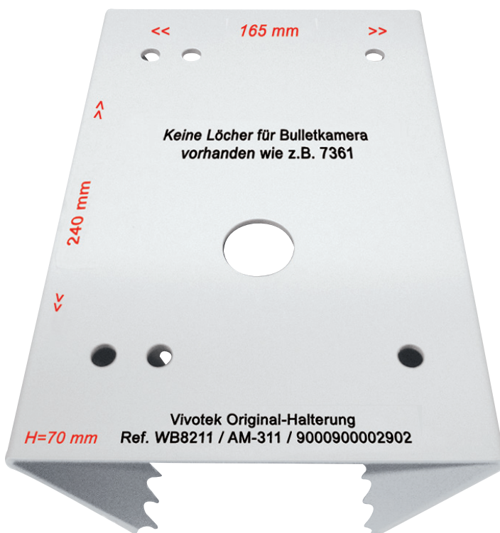
Vivotek original Halterung Gewicht: 1720gr