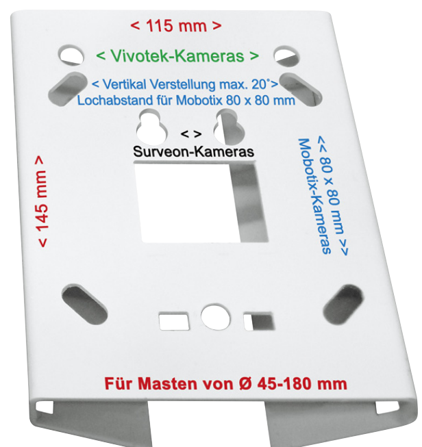
Der neue „clevere“ Universalhalter Gewicht: 500gr